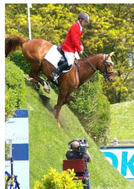
Foto: Matthias Granzow mit Antik; Antik 2008 im Derbypark © Karl Lohrmann

und einen nach dem Sport im Stall von Christoph Seite. Herzlichen Glückwunsch!